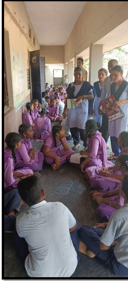
Later volunteers conducted quiz competition to school students.